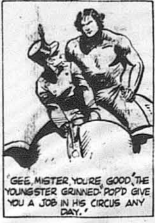
«Але ви вмієте скакати!» по-дивився хлопчина. «Ви моглиб зарїзї дістати роботу в цирку».