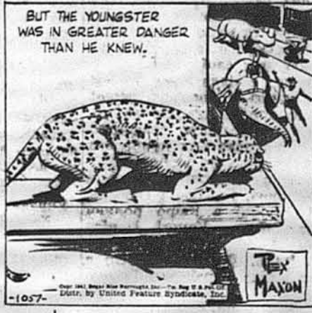
Але хлопчина був у більшій небезпєцї, як він знав.