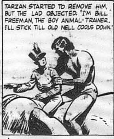
Тарзан хотів зняти хлопця зо слона, але хлопєць не дав-ся. «Я треную звірів. Я лишусь тут, поки вони не впокояться».