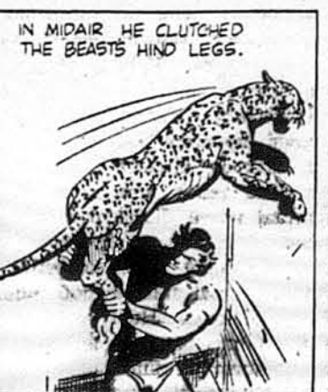
Сильні руки приймали звіра в повітря.