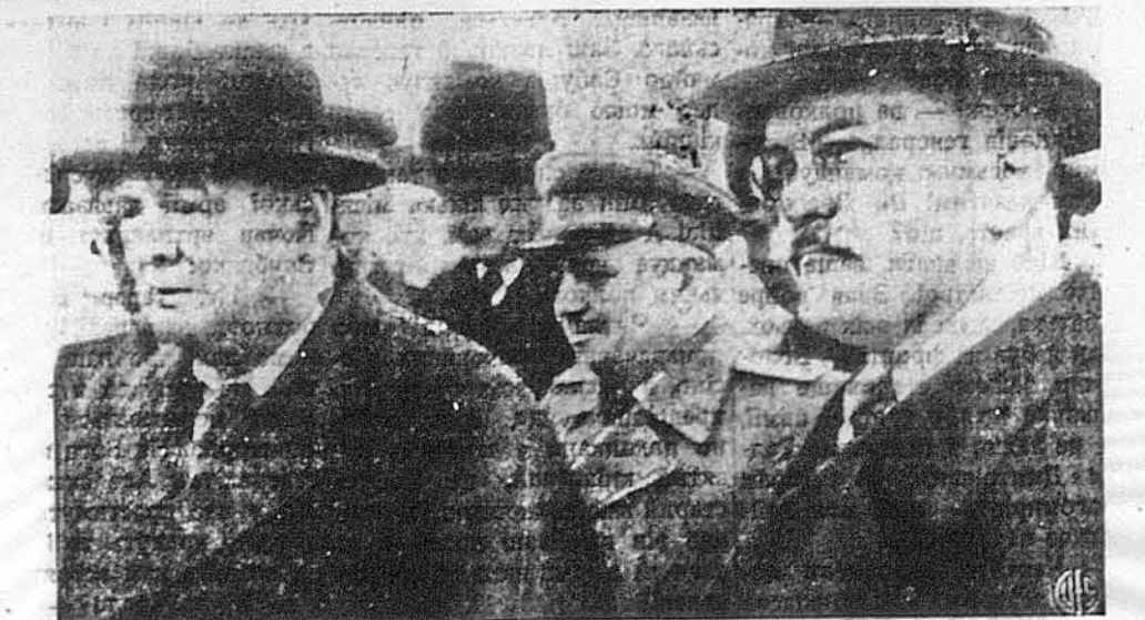
ЧОРЧИЛ У МОСКВІ НА ПЕРЕГОВОРАХ З СТАЛІНОМ. Зліва бачимо британського прем'єра Вінстона Чорчила, з виглядом перетомленого довгою дорогою, як він сидів у Москві з літака, повітаний Вячеславом Молотовим (справа), советським міністером закордонних справ. Чорчил уже конферував двічі з Сталіном, і то, як кажуть, головню в справі Польщі, себто польсько-советських границь, і двох польських урядів, того, що в Лондоні, й того, що в Любліні.

ЛОНДОН. — Вісті з Москви подають, що головною перешкодою для довершення угоди між советським урядом і польським урядом у Лондоні є справа східної границі Польщі. Не дивлячися на те, що з конференції британських, польських і советських політиків в справі польсько-советської згоди не подано ніяких офіційних комунікатів, обсерватори догадують з різних даних, що представники польського уряду на вигнання стоять твердо й неуступчиво на становищі давніх границь Польщі. Зогляду на те, що й Москва в цій справі стоїть неуступчиво на своїм становищі, подальші дробуть добитися угоди через відложення вирішення граничної проблеми аж до часу по війні. На це одначе советський уряд не годиться, а Чорчил, що вже раз заявився за лінію Курзона, відай напірає на поляків признати домагання Сталіна. Досі відбулися вже конференції Чорчила й Ідена з Міколайчиком та Ромером, були теж конференції Ромера, Градського й Міколайчика з американським амбасадором Гарріменом, але ще не було конференції між представниками польського уряду в Лондоні та представниками Польського Комітету Національного Визволення.