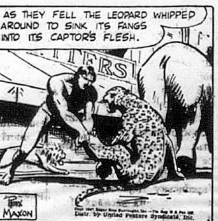
Як оба впали на землю, леопард замахнувся, аби запу-стити пащу в мясо против-ника.

TARZAN HAD JUST DESCENDED WHEN HE SAW A LEOPARD PRE-paring TO SPRING ON THE BOY ATOP THE ELEPHANT. A MOMENT LATER THE LEOPARD LEAPED. THE MIGHTY JUNGLE-LORD SPRANG TO MEET HIM. IN MIDAIR HE CLUTCHED THE BEAST'S HIND LEGS. AS THEY FELL THE LEOPARD WHIPPED AROUND TO SINK ITS FANGS INTO ITS CAPTOR'S FLESH.