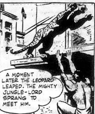
За хвилину потім леопард ско-чив. Могутній Тарзан скочив за ним.