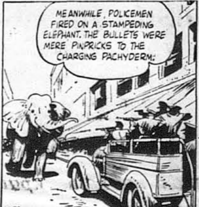
Тимчасом поліцейські стріляли на одного спокоеного слона, та кулі робили на нього таке враження, як уколення іглою.