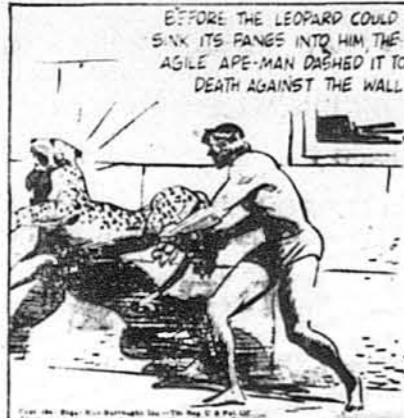
Поки леопард міг запусити пазурі або зуби в тіло Тарзана, цей розбив йому голову ударом об стіну.

UKRAINIAN NEEDLERS заряджує погребнями по $150 ціні так низькій як ОБСЛУГА НАЙКРАЩА.