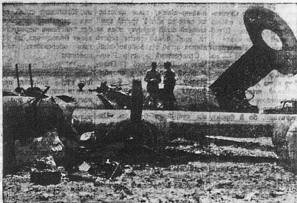
ПО РОЗБИТТЮ БОМБОВОЗА. — Це так розбився „Ліберейтор“ десь на однім з островів на Полудневім Паціфіку. На шастя, хоч літак злітаючи на землю, цілком розбився, ніхто з залогі і ранених, що були на літаку, не втратив життя, ні не лоніс серйозних ран.

ЛОНДОН. — Лондонські поляки не бачать зовсім основ називати московську конференцію успішним кроком для вирішення польської проблеми. Польський уряд на вигнання відмовився відбуту в цій справі конференцію з пресою. Зате збирається обговорити рапорт Міколайчика на засіданню, котре відій потриває кілька днів.