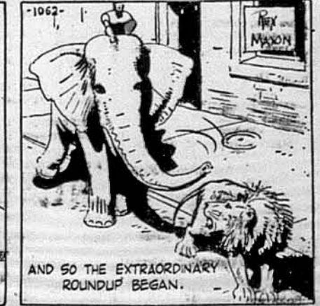
AND SO THE EXTRAORDINARY ROUNDUP BEGAN.

Він крикнув до циркового хлопця, що ще далі сидів на слоні: