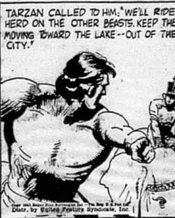
TARZAN CALLED TO HIM: 'WE'LL RIDE HERD ON THE OTHER BEASTS. KEEP THEM MOVING TOWARD THE LAKE--OUT OF THE CITY.'