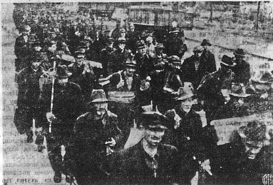
ПОЛОНЕНІ, НІБИ ЦИВІЛЬНІ. — Особи, що їх бачимо перед собою, це німецькі воєнки, переодягнені в цивільний одяг, щоб таким чином обманути алянтську владу і не потрапити в полон. Та їх пізнали і, як бачимо, перевозять з Франції до Англії до таборів полонених.

ЛОНДОН. — Останнє число підпольної еспанської газети „Добуття Еспанії“ подає явний заклик до революції проти диктатора Франка. Заклик взиває офіцерів і воєнків еспанської армії звернути зброю проти Франка й фаляністів. Часопис доносить про зріст протидиктаторського руху в Еспанії. Бритійські газети кажуть, що ці вісті пересаджені. Німецьке радіо каже, що це большевицьке повстання та що воно вже здушене Франком. Хосе Міаха, генерал еспанської республіканської армії, що тепер перебуває на вигнанні в Мексикі, називає сутнички партизанів з правильними еспанськими військами глупотою.