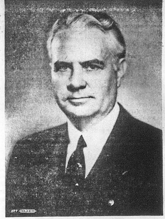
GOVERNOR JOHN W. BRICKER

ТОМАС Е. ДЮЇ Наш Кандидат — НА — Президента Злучених Держав голосуймо всі на ТОМАСА Е. ДЮЇЯ Та виберім його наступним президентом нашої держави