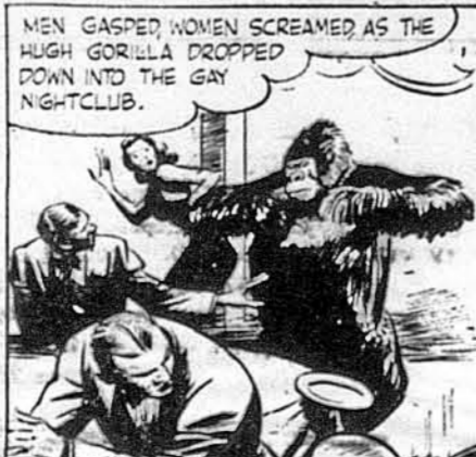
MEN GASPED WOMEN SCREAMED AS THE HIGH GORILLA DROPPED DOWN INTO THE GAY NIGHT-CLUB.

BRANCH OFFICE & CHAPEL 707 Prospect Avenue, (cor. E. 155 St.) BRONX, N. Y. Tel.: MEIrose 5-6577