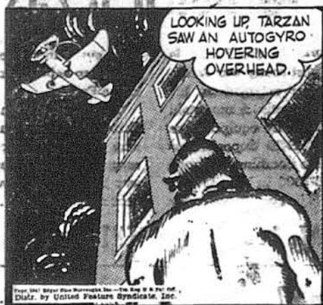
Поглянувши вгору, Тарзан побачив літак-автожиро.