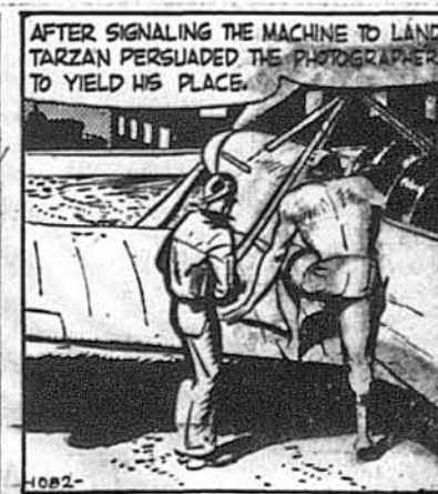
Тарзан дав йому сигнал осісти, а потім уприсився заняти його місце.