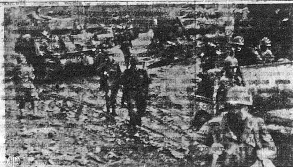
БОЛОТО НАЙБІЛЬШОЮ ПЕРЕШКОДОЮ В ОФЕНЗИВІ. — „Генерал-Болото“ має своє сильне слово на німецько-аліантському фронті над Реном. В модерній війні тенки відрають велику роллю. Без них нема ніякої поважнішої воєнної операції, а болото є саме найбільшою перешкодою для операцій при допомозі повзів. На образку бачимо, як британські тенки посуваються по такій болотистій дорозі, десь над Реном.

РИМ. — Російські круги заворушилися, коли вороги фашизму зажадали суду над російським князем Сергієм Романовським, кузином князя Гумберта; закидують йому, що він подавав колись фашистському уряду імена москалів, що противилися фашизму.