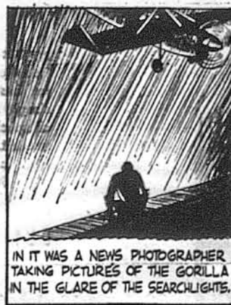
У ньому сидів газетний фотограф, що знімав образки з погоні за звірами.