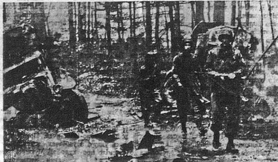
НАД РЕНОМ ДОРОГИ ЗАВАЛЕНІ АВТОМОБІЛЯМИ І ТРОКАМИ. — Як поглянути на цей образок, що знятий десь над Реном, то побачимо американських вояків, що патрулюють, а теж понижений автомобілі. Недавно посувалися тими дорогами, що перед нами, німецькі транспортні, та їх торощила американська артилерія в такий спосіб, що тепер ці дороги просто завалені розторощеними автомобілями.

„Хаос“ каже Спак „буде тривати довго, так довго, що повний розклад Німеччини виглядає можливим“.