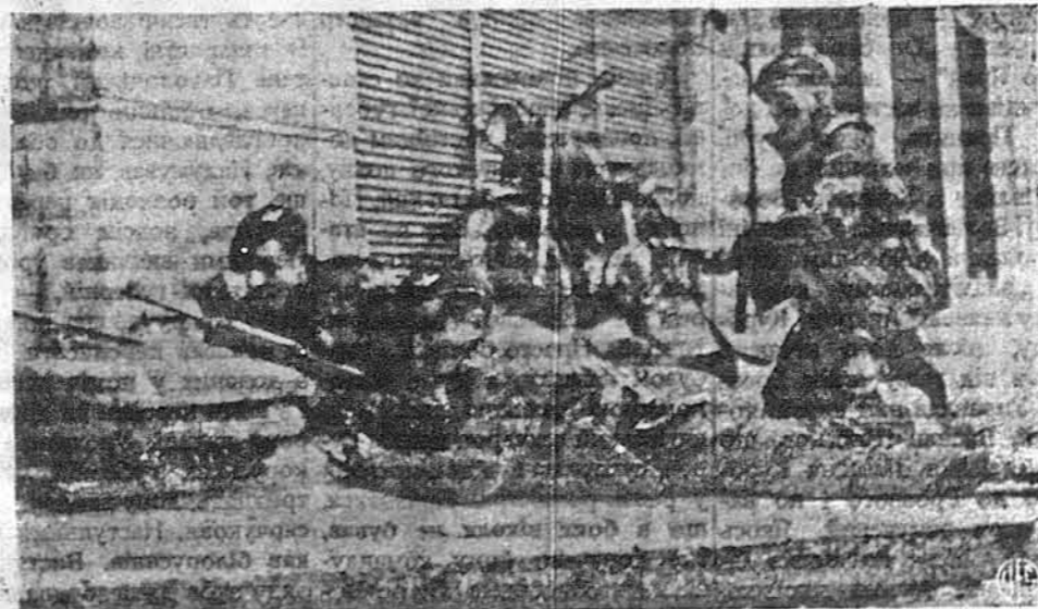
СЦЕНА З ВУЛИЧНИХ БОЇВ В АТЕНАХ. — Бачимо на тому образці британських вояків, як присіли на одній з вулиць столиці Греції, щоб стріляти до ворохобників, виконуючи ось так розпорядок британського прем'єра Чорчила, щоби завести в Греції „лад і порядок за всяку ціну“.

Чехословацький уряд у Лондоні надіється, що судетські німці, що до цієї війни йшли за нацистичним провідником Генлаїном, перенесуться до Німеччини; чехословацький уряд дозволить остатися в Чехії тим німецьким соціал-демократам, що не піддавалися нацистичній пропаганді.