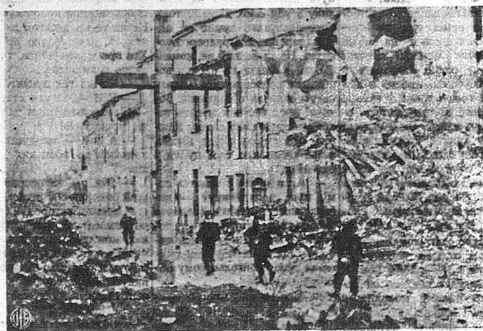
НЕНАРУШЕНИМ ОСТАВ ТІЛЬКИ ОДИНОКИЙ ХРЕСТ. — Маємо перед собою частину руйнітального міста Фаенци, славного ще з 15. століття з своїх глиняних виробів, з чого походить теж і назва міста. Воювачі з Ново Зеландії підходять осторожно до міста попри хрест, який зівстав неушкодженим, хоч все інше довкола нього потерпіло від бомбардування.

ГОЛОВНА КВАТИРА НА ФІЛІПІНСЬКИМ ОСТРОВІ ЛЕЙТЕ. — Війська 77. дивізії посунулися три милі на захід від ормського коритара впалямі порту Пальомпону, з якого японці погли би втікати з острова Лейте. Американська артилерія почала бити по ньому всею силою. Американські воювачи нарахували за тиждень 12,873 трупів японських воювачів. Американська команда каже, що на Лейте гине пересічно кожного дня коло півтора тисячки японців.