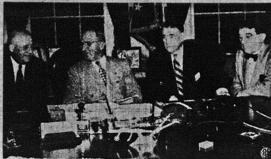
НАРАДИ ПЕРЕД ОТВЕРЕННЯМ КОНГРЕСУ. — Перед нами наради конгресових провідників з президентом Труманом. Обговорюють найважливіші справи, що їх пропонує президент конгресові. Зліва направо: спікер Сем Рейбурн з Техасу; президент Труман; провідник сенатської більшості Албін В. Барклі з Кентукі; і сенатор Кенет Менкеллар з Тенесі, тимчасовий президент сенату.

Андрійко побіг до старої криниці, відкинув з неї сіно та ломача, подивився до споду, а там до половини повно леду. Вода в криниці грубо замерзла і не дала ще сліду таяння. Врдаваний Андрійко дав знати матері. До пізної ночі усі вони зносили до криниці, по кавалкові, того оленя (600 фунтів мяса) і зложили всенке мясо на лід у криниці тай шільно закрили криницю, аби туди тепло не доходило. Ли-