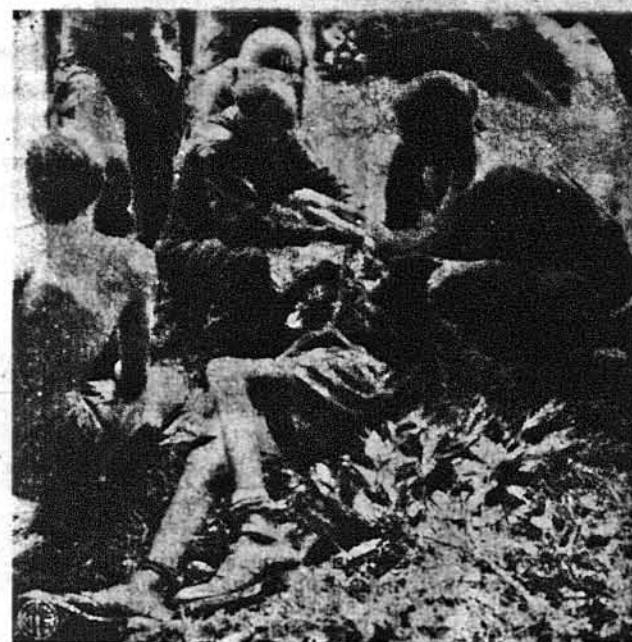
ТРИ РОКИ В ЯПОНСЬКОМУ ПОЛОНІ. Це лежить го- ляндський вояк, що попав у японський полон, де пере- быв три роки. Тепер його визволили американці в Йо- кагамі. З нього остане тільки кістка. Американський лі- кар заважає рани і пробує оживити організм.

Чемберейдс Бетмейдс Сімстрес Добра платня, стала робота Lombardy Hotel, 111 E. 56 St., N. Y.