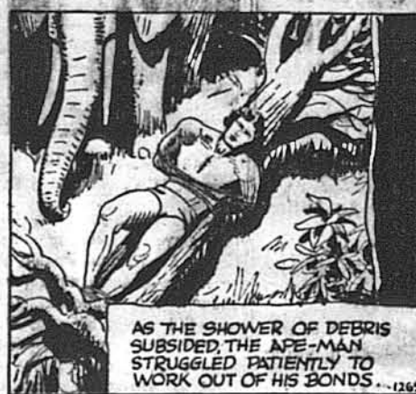
AS THE SHOWER OF DEBRIS SUBSIDED, THE APE-MAN STRUGGLED PATIENTLY TO WORK OUT OF HIS BONDS.