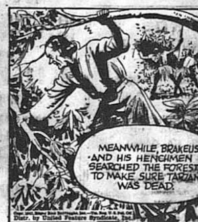
MEANWHILE, BRAKEIS AND HIS HENCHMEN SEARCHED THE FOREST TO MAKE SURE TARZAN WAS DEAD.