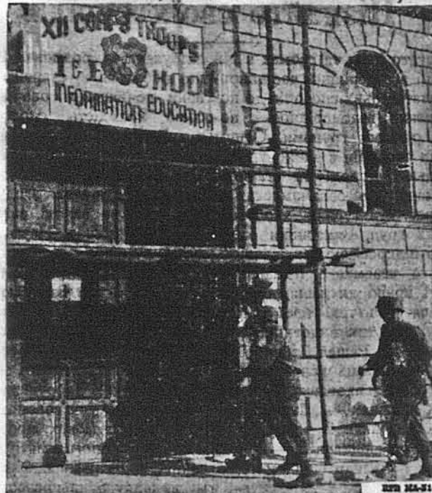
Text books in hand, American soldiers serving as occupation troops enter the school opened for them under the U. S. Army Education Program in Regensburg, Germany. Education and trade training are two of the inducements offered to those who enlist in the Regular Army. Qualified civilians 18 to 34 years of age, inclusive, now can enlist at any U. S. Army Recruiting Station.