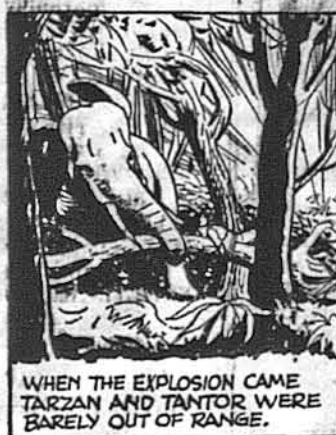
WHEN THE EXPLOSION CAME TARZAN AND TANTOR WERE BARELY OUT OF RANGE.

Роман у 2-ох частях знаменитого повістяр Уласа Самчука Сторін 194. — Ціна $1.00. Замовлення разом з належністю слати до: “Svoboda” P. O. BOX 346 JERSEY CITY 3, N. J. 3 Копії замовлення треба платити американською валютою.