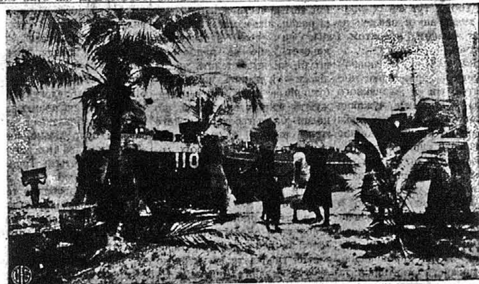
ВИСЕЛЮЮ МІЩАНЦІВ БІКІНІ АТОЛЬ. — Супроти цього, що в травні мають відбутись на Паціфіку, довкола островів Бікіні Атоль, атомові „маневри“, випроваджують тепер з тих островів тубильців до подальших островів. На образку бачимо тубильців, як переносять своє добро на корабель.

Комітет палати репрезентантів для слідження Неамериканських Займ, оприлюднив рішення, що висилає до Канади своїх представників, які будуть призибувати матеріали для ствердження, як далеко пішло розгалуження шпигунства з Канади на американську землю. Водночас Дін Ачезон, підсекретар стейту, заявив, що департамент стейту був вперед поінформований про потребу арештування советського офіцера маринарки за його шпигунство.