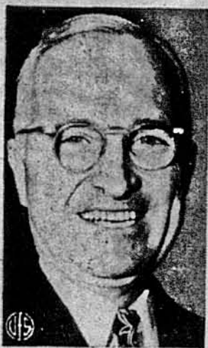
ПРЕЗИДЕНТ У 62-й РОКІ ЖИТТЯ. — Обличчя президента Трумана щеком не зраджує, що він уже має 62 роки. Кажуть, що почуває себе змороженою. Фотографія знята на переліт уроду.

І шкода нам не на вас. Ми гадаємо, що ви запродалися, як і всі інші „за шмат гнилої" кремлівської ковбаси, навіть не добре знаючи кому продається. Шкода нам того, і саме, вас і подібних запроданців, що ви, нещасні люди. З одного боку тим, що на вас дивляться всі, як на запроданців (навіть чужоземців не обведе те навколо, дітей і не тікали світ за очі). Вониб не хотіли скитатися по чужинах. Бо чужина є чужина: як не є добре в гостях, а в своїй господі краще!.. Однак ці сердешні люди — другі групи, — мусіли кинути все, що мали і в голоді й холоді: тікали за тисячі кіломет-