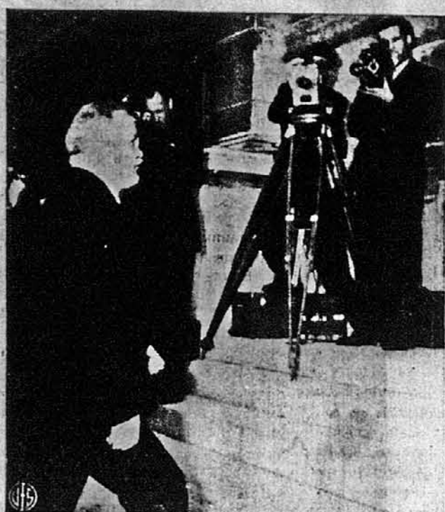
ЛЮДИНА, ЩО МАЄ НА ВСЕ ОДНУ ВІДПОВІДЬ: «НІ». — Так характеризують в Парижі Вячеслава Молотова, советського інстара закордонних справ, що вчасі нарад Мирової Конференції ставиться до всіх пропозицій не-гативно. Фотографію скопили його, як іде по сходах до Луксезбруської Палати, від відбуваються наради.

І чи ж не є це дивне історич-не непорозуміння, незрозуміла непорозуміння, що ми, україн-ці, маючи найкращий у світі край за батьківщину, не можемо на-реши вибороти для себе того Свого Краю? Бо «у своїй хаті, своя правда і сила і воля»... а наш табор уявляє собою ніби