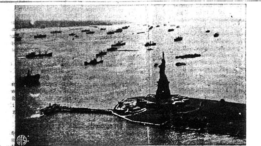
„СВОБОДА“ СПОГЛЯДАЄ НА КОРАБЛІ В БЕЗДІЛЛІ. — Перед нами славна „Статуя Свободи“, що споглядає на масу кораблів, що через страйк не відпливали в різні сторони світа, а були розташовані на водах близько ньюйорської пристані. В Нью Йорку було їх до 400, а в цілому краю до 1,200.