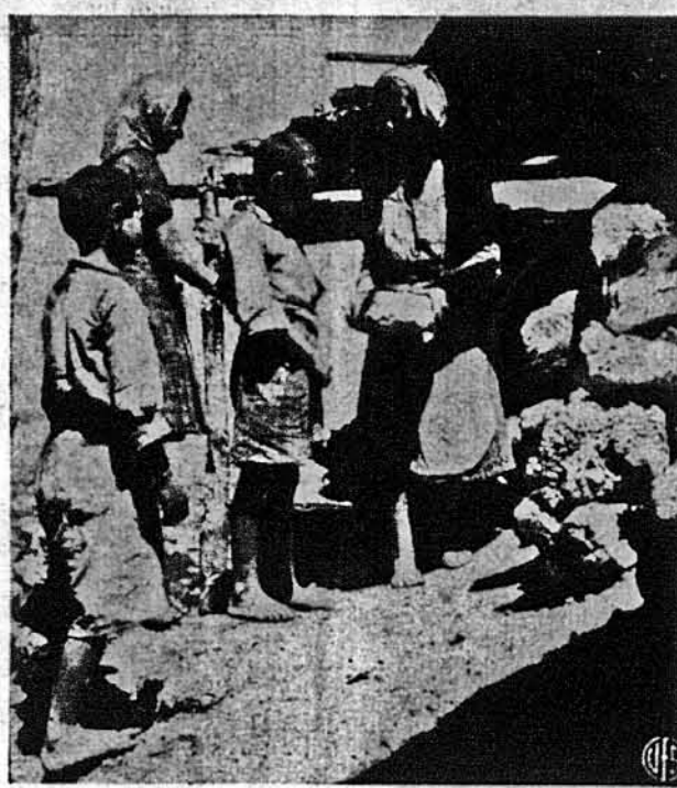
КАРТИНА, ЯКИХ ТЕПЕР В ЄВРОПІ ТАК БАГАТО! — Боса жінка, що спекла бохонець хліба в печі, викопаний у землі, дає по кускові трьом голодним дітям! Це в Греції, але може бути і в будь якій іншій країні, знищеній війною.

І якраз метою цієї чистки є між ін. і те, щоб тих письменників, які трохи познайомились зі „заходом“, і на яких вплинули західні ідеї — усунути з літературного життя, щоб своїми творами не впливали на зміну поглядів в пересічного, сірого советського громадянина, а інших письменників змусити до безоглядного підпорядкування себе директивам і наказам большевицької партії.