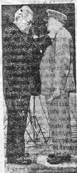
ЩЕ ОДИН ОРДЕР ДЛЯ ЧОРЧИЛА. — Французький прем'єр, Пол Рамаді, декорує в Паризі найвищим французьким відзначенням, Мілітарною Медаллю, британського прем'єра воєнних часів, Вінстона Чорчила.

стишені, Великий, Зборів, від Глас, Писифа.