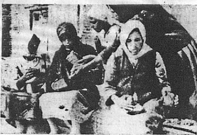
Українські жінки, жертви війни, яким ЗУАДКомітет мусить допомогти