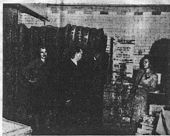
Бейли одіжи, спаквані Жінчою Секцією ЗУАДКомітету в Нью Йорку, готові на корабель до Європи

Досі членами Комітету з постійними обов'язковими вкладками були тільки приблизно