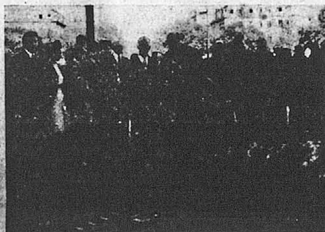
Українська делегація, на чолі з Всев. о. Мітратом Перрідонем і д-р Галаном, на могилі французького Невідомого воєвжа