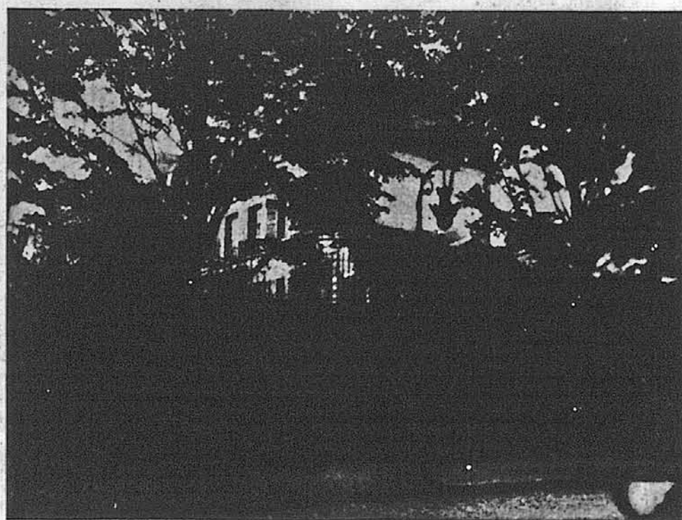
Вид з вулиці на Український Дім у Парижі, закуплений для вжитку й помочі нашим братам у Франції ЗУАДКомітетом. В Домі тепер ведуть гарну працю опіки над дітьми й скитальцями СС. Службінці.

І так проминув цей незабутний день. Він не тільки скріпив у серцях українських скитальців живу віру, що в єдності незломна сила народу, але також підбадьорив усіх у надії, що при взаємній допомозі й жертвенності ніякій ворожій силі не вдасться знищити нашого життєздатного і невмирущого народу.