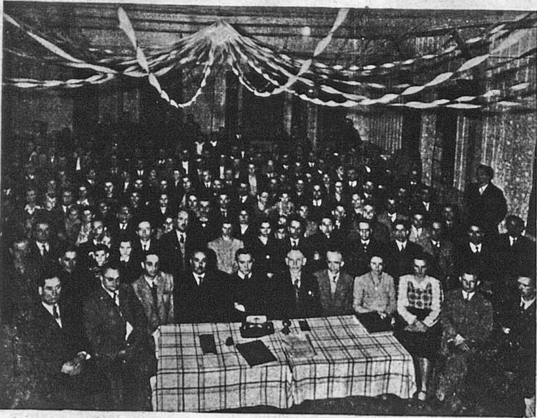
КОНГРЕС УКРАЇНЦІВ В БРАЗИЛІЇ

ШАНОВНІ ЧЛЕНИ У. Н. СОЮЗУ! Ви дістали листа з проханням, щоб кожний і кожна з Вас придбали для Союзу бодай по одному членові. Отже не забувайте на цей заклик своєї організації і відгукніться на нього таки зараз, таки ще цього місяця, бо тільки в такий спосіб зможемо збільшити Союз до 50,000 членів ще до кінця цього року!