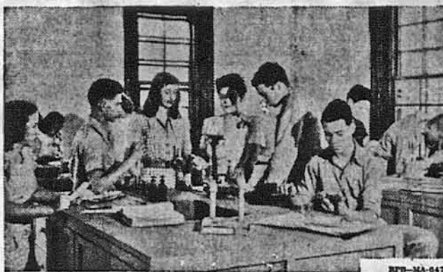
The Seoul American School, Seoul, Korea, is typical of many educational institutions set up in foreign countries for the sons and daughters of military and civilian personnel. The students at work in the science laboratory above follow a curriculum similar to that of the high schools in the United States.