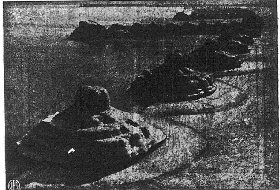
МИСТЕЦТВО ПРИРОДИ. — Сніг та морози виробили це чудо, що є зимовою прикрасою Мишугинського озера.

ОРГАНІЗАЦІЯ ОБОРОНИ ЧОТИРЬОХ СВОБІД УКРАЇНИ улаштує БАЛЬ СВ. ВАЛЕНТИНА В СУБОТУ, 14. ЛЮТОГО (FEBRUARY 14, 1948) В УКРАїнській СІЧОВИЙ ГАЛІ, 508 — 18th AVENUE, NEWARK, N. J. Орхестра Стефана Чельяка. Початок 8. вечором. Вступ 85¢ Шановні Громадяни й Громадянки! Прохаємо усіх Вас прийти на цей Баль св. Валентина, що буде мати дійсну несподівану сенсацію так зв. Комедії Сміху, що підготовляють нові іммігранти. Крім цього ручимо, що Ви дійсно заставите у відповідному товаристві, з добрим буфетом, та тим способом поможемо цій великій справі, за яку боряться укр. вояки, герої УПА. Приходьте усі! — Кличте своїх знайомих! Управа Від. О.О.Ч.С.У. в Ньюарку.