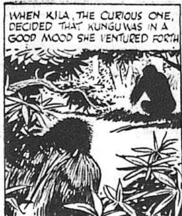
WHEN KILA, THE CURIOUS ONE, DECIDED THAT KUNGU WAS IN A GOOD MOOD SHE VENTURED FORTH