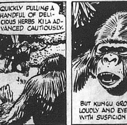
QUICKLY PULLING A HANDFUL OF DELICIOUS HERBS KILA ADVANCED CAUTIOUSLY.