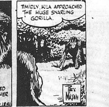
TIMIDLY KILA APPROACHED THE HUGE SNARLING GORILLA.