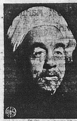
ПАЛЕСТИНА—АРАБАМ, каже Абдул, король Трансйорданії, а як так станеться, то жиди вже дістануть своє „національне пристановище" титули своїх горючих прав.

Кіш був усе розташований недалеко фронту, в етані корпусу й це вможливляло його