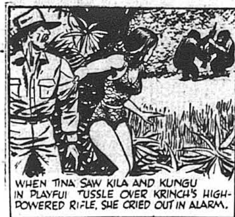
Коли Тіна побачила Кілу і Кунгу, як вони бавилися спокійно сильним крісом Кринча, вона закричала на сполох.

Москва, 29. червня. — Тут знову поширилися вперті поголоски, що після короткої перерви советський уряд знову планує введення раціоналізації та пайкування харчів в країні, що мало б бути проголошене вже з кінцем серпня та до чого вже ведеться відповідна підготовка партійними і адміністративними властями на місцях. Причиною цього вважається харчові труднощі з одного боку, а господарський хаос і нову підготовку до війни з другого.