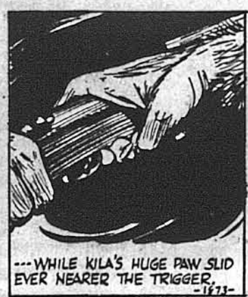
...а велика рука Кілі все збижалася до язичка.