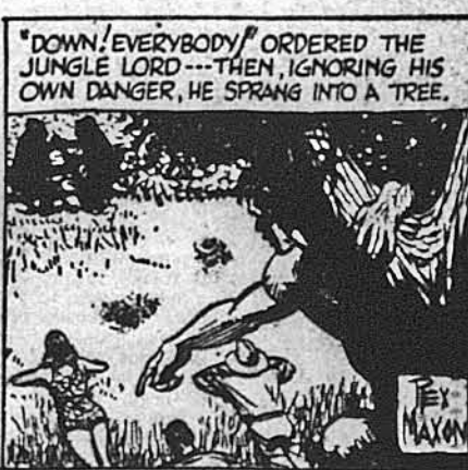
„Усі на землю!" — видав наказ пан джунглів. — описав, не зважаючи на свою особисту небезпеку, він вискочив на дерево.