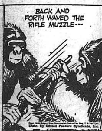
Взад і вперед шарпали вони дулю кріса...