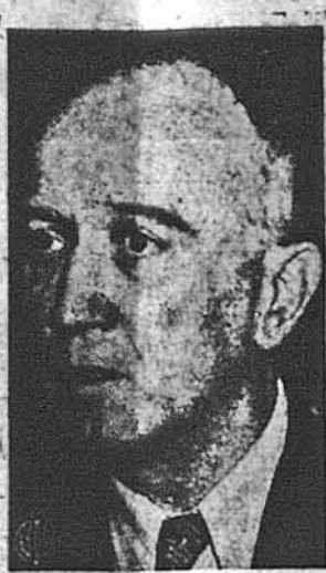
НАЙБІЛЬША АМЕРИКАНСЬКА КОМУНІСТИЧНА ШИШКА В КЛОП-ТАХ. —Це Іллям 3. Фостер, кра-євий голова Комунистичної партії і один з 12 комунистичних верховод-ців, що їх Федеральне Гренд Дюрор обвинуває в злочинності до Злу-чення Держав. Згідно зі законом Сміта з 1940 року Фостер та інші комунистичні відомці перед судом за намагання схити шляхом насиль-дя державний переворот у Злучених Державах.

Музична банда заграла марш, члени товариства під прово-дом заступника голови Марти-на Малетича й інших членів уряду обійшли походом парк, а потім усталися при пре-столи. Ця маніфестація сама