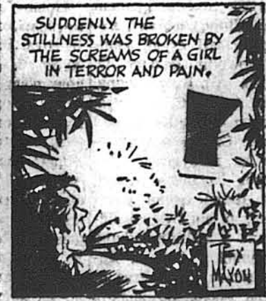
SUDDENLY THE STILLNESS WAS BROKEN BY THE SCREAMS OF A GIRL IN TERROR AND PAIN.

Коли перелякана дівчина стояла безпомічна, в дверях явилася зловіща голова Гідзелевого попихача.