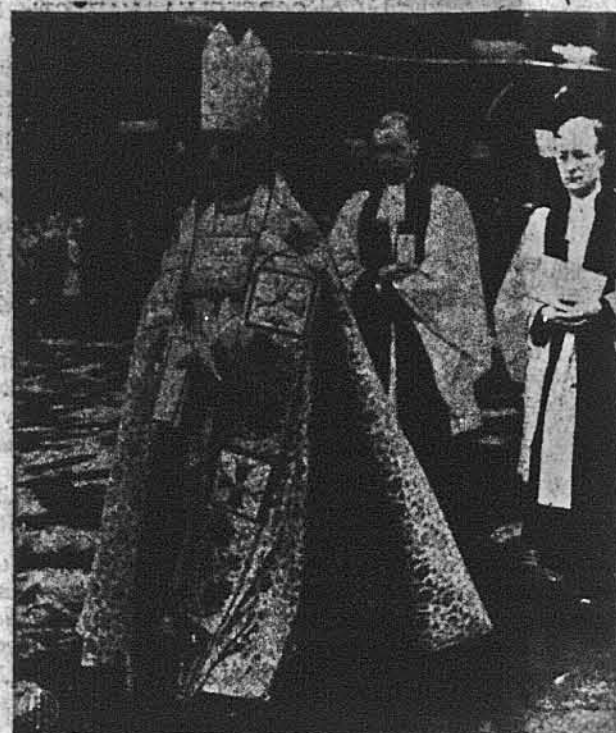
З КОНФЕРЕНЦІЇ В ЛАМБЕТ. — Д-р Джофрі Френсіс Фишер, 97-ий архієпископ Кентербері і примас всієї Англії, йде в процесії на спеціальне богослужіння до Вестмінстерського Ігуменату на закінчення конференції Англійської Церкви, званої Конференцією з Ламбет. На конференцію приїхали англійські єпископи з цілого світу.

По кінотеатрах України демонструється документальний кінофільм „Дніпрельстан“, виробу української студії кінохроніки. Авторі фільму О. Підгорецька і М. Большинцов. Сценарій план Е. Крігера, композитори — Д. Клебанов і О. Сандлер. Сюжет фільму — боротьба за відбудову. Спочатку перед глядачем демонструється Дніпрельстан в такому стані, як він був до війни, як одна з найпотужніших електростанцій в Європі.