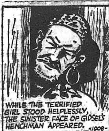
WHILE THE TERRIFIED GIRL STOOD HELPLESSLY, THE SINISTER FACE OF GIDSEL'S HENCHMAN APPEARED.

ТАРЗАН, ч. 1908. Дівочі крики серд ночі.