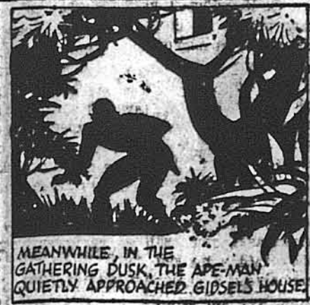
MEANWHILE, IN THE GATHERING DUSK, THE APE-MAN QUIETLY APPROACHED GIDSEL'S HOUSE.