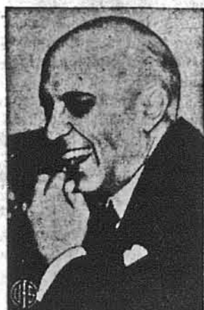
ПАНДІТ НЕГРУ, прем'єр Індії, знайти в Лондоні в часі, як сміється, прислухуючись, як ойго представляють на бенкеті його земляки.

У вівторок рано оповив мою парафію великий сум. Досвіта появилися на середині села кільканадцять большевицьких тягачів самоходів. На кожному стояло по кілька озброєних красноармійців. Нагло ті самоходи рбзхались, кожний до іншої хати. Красноармійці мигом обступили подвір'я кожної хати, а цей, що стояв з