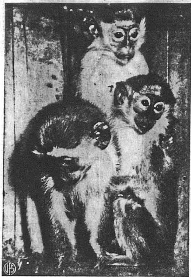
ДОВИЙ ДОДАТОК ДО ЗООЛОГІЧНОГО ГОРОДУ В РАЧЕСТЕР.—Ці три малі привезено з Африки до зоологічного городу в Рачестер, Н.Я. Мають по 6 місяців.

І в самій пресі і в розмовах часто чується нарікання, що тут роджена від українських родичів молодість відшестяється від свого коріння, часом погорджує мовою своїх батьків і соромиться свого походження. Буває й таке. Але про ту молодість, з якої складаються ці два хори, так сказати було б гріхом. Навчались і співати з