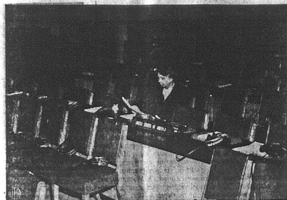
ПРИЙШЛА СКОРО, ЩОБ ДОБРЕ ГРИГОВИТИСЬ, ЩО ВІДПОВІСТИ СОВЕТСЬКИМ ДЕЛЕГАТАМ.—Це Миссис Еліно Рузвелт, американська делегатка до Асамблеї Об'єднаних Держав. Як бачимо, то крім неї нема нікого на салі. Це вона шукає за аргументами, щоб переконати совєтський уряд, що він повинен випустити з Совєтів тих чоловіків і жінок, що подружились з чужинцями, згл. американцями чи американками.

„Не вдавайте, що ви спите!“ — кричав розлючений генстер. „Хто забрав мені діаманти“.