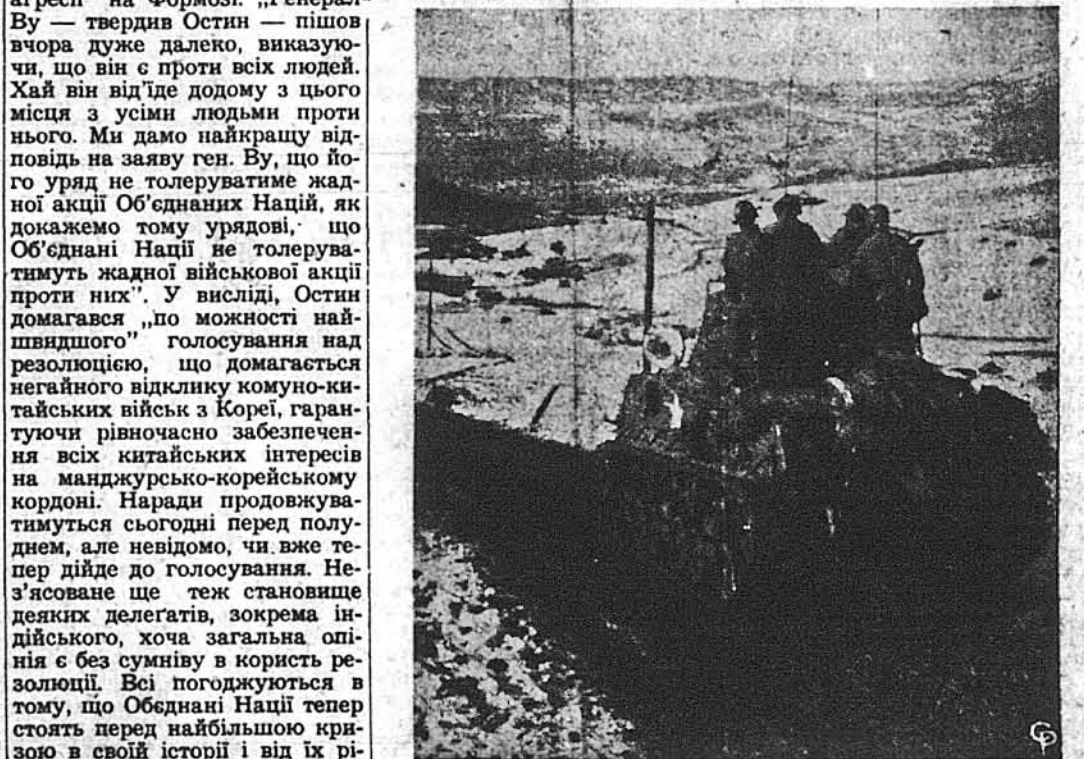
АМЕРИКАНСЬКІ ТАНКИ НА МАНДЖУРСЬКОМУ КОРДОНІ. Тоді, як на західному секторі корейського фронту альянські війська відступали під сильним напором переважачих комуно-китайських сил, на східному фронті американці дійшли до манджурського кордону на річці Ялу біля Гесандзіна.

ОСТИН ПРОКИДУЄ „ФАНТАСТИЧНІ БРЕХНІ КОМУНО-КИТАЙСЬКІ ПРЕДСТАВНИКА” Лейк Соксес, 30. листопада. — Американський представник в Раді Безпеки, Ворен Р. Остин, домагався вчора негайного голосування в справі резолюції щодо відкликання комуно-китайських військ з Кореї, опрокидуючи при цьому „фантастичні брехні” комуно-китайського представника, ген. Ву Гсін-чуана, на попередньому засіданні щодо „американської агресії” на Формозі. „Генерал” Ву — твердив Остин — пішов вчора дуже далеко, виказуючи, що він є проти всіх людей. Хай він відіде додому з цього місця з усіма людьми проти нього. Ми дамо найкращу відповідь на заяву ген. Ву, що його уряд не толеруватиме жадної акції Об'єднаних Націй, як домагаємо тому урядові, що Об'єднані Нації не толеруватимуть жадної військової акції проти них”. У висліді, Остин домагався „по можності найшвидшого” голосування над резолюцією, що домагається негайного відклику комуно-китайських військ з Кореї, гарантуючи рівночасно забезпечення всіх китайських інтересів на манджурсько-кореїнському кордоні. Народи продовжуватимуться сьогодні перед полуднем, але невдовзі, чи вже тепер дійде до голосування. Нез'ясоване ще теж становить деяких делегатів, зокрема індійського, хоча загальна олінія є без сумніву в користь резолюції. Всі погоджуються в тому, що Об'єднані Нації тепер стоять перед найбільшою кризою в своїй історії і від їх рішення залежатиме не тільки доля цієї міжнародної організації, але й самого світу.