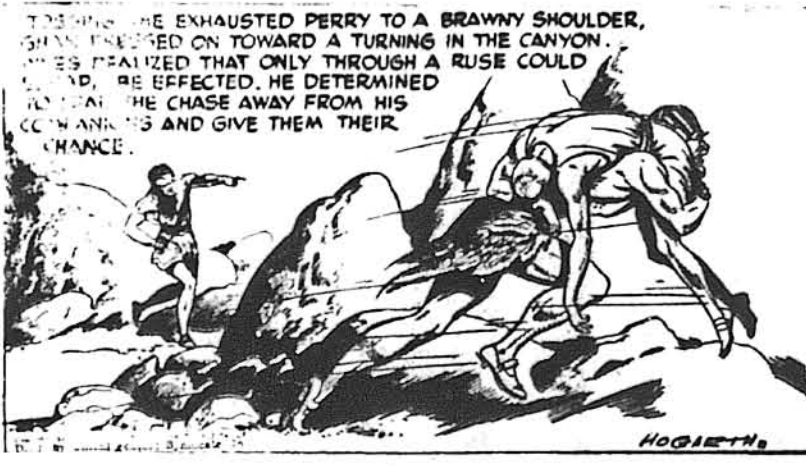
ТАРЗАН ч. 2532. Заніс Перрія в безпечне місце

Перекинувши обезсилєного Перрія через плєчє, Гтак гнав вперед до закруту в пропасті. Іннес зрозумів, що тільки під-