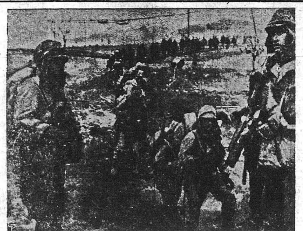
ДИВІЗІЯ МОРСЬКОЇ ПІХОТИ ЗНОВУ В АКЦІЇ. Після деякої перерви війська цієї славної Дивізії знову в поході проти червоного агресора в Кореї, в якому не зупинили їх ані ворожий спротив, ані „генерал Болото“, ані „полковник Мряка“.

Влада Міського Каледжу Нью-Йорку припинила дальші спортивні змагання студентів в Медисон Сівер Гарден після того, як підчас гри на університетських майдані („Кампусі“) детективи арештували провідного спортсмена студента Флойда Дж. Даяна. Він признався, що дістав $2,500 за фальшиву гру в користь інших друзинь. Як свідок проти Міжнародного Робітничого Ордену виступав в нью-йоркському суді Луї Вуден, колишній редактор комуністичної газети „Дейлі Воркер“. Він ствердив, що голова ордену, Раквел Кент, був комуністом в рр. 1935-45. Суд пересудує свідка, для вирішення, чи затвердити роз'язання ордену, як це наказав комісар безпеки нью-йоркського стеги. Сен. Артур Вайденберг, один з провідних републиканців у Конгресі, трагичні сльми на шляху до відкриття після операції. До хворого батька приїхав його син, який перебуває в Бразилії. „Не в відносності до мене“ — сказав през. Труман, коли його запитали про його думку в справі Двадцятьдвої поправки до Конституції. Це розуміють різно: Він може або квалідувати на президента ще раз, а може теж не планувати квалідувати. Об'єднані Нації відкинули британську пропозицію, щоб комуністичного представника допустити до участі в нарадах Азіатської Господарської Комісії О. Н.