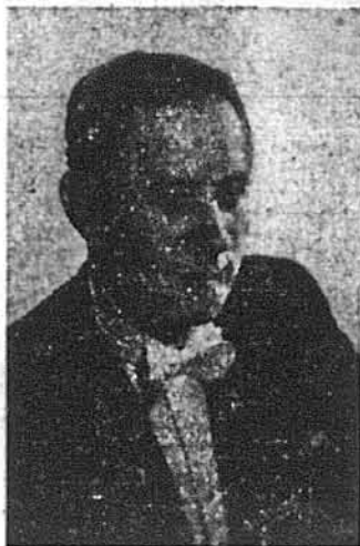
Український піаніст Борис Максимович, якого дебют в Нью Йорку відбувся 23 травня ц. р. в Тавні Гол.

Уродженець і вихованець Києва, почав свою концертну кар'єру дуже рано ще 8-літнім хлопцем. Його визначний талант і витривалість та цілеспрямованість вели до щораз нових досягнень. До його видатних успіхів належало м. ін. перше виконання з оркестром фортепіанового концерту українського композитора Віктора Косенка. Правда, в підсвіткових умовах його можливості як українського мистця були доволі обмежені. Його заставляли часто до інших, не раз канцелярських робіт і не давали змоги сконцентрувати-