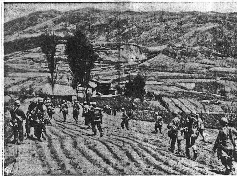
В ОЧІКУВАННІ „ДРУГОЇ ФАЗИ“ ВЕСННЯНОГО НАСТУПУ червоних, тяжко озброєні з'єднання американської 25-тої дивізії підходять через корейські поля до фронтової лінії.

Хотів заробити $50.000 на продаж поштових карток листоноша Франсіс В. Галетт з Врукліна. Фірма Сіменс Бредлі вислала була до мешканців Брукліна поштові картки, на яких було повідомлення, що власник картки дістане безплатно мішочок кави, коли зголюється до торгівлі з карток. Листоноша почав скопувати такі картки по 8 центів і перепродавати діном бізнесменам, яких теж апитувала влада. Вони хотіли поділитися зиском з такої „трансакації“. 1.400 вестернів повернулися з Корейської війни до Сан-Франсиско, а на їх місця підуть інші воїни. Між повернутими є 121 офіцерів і 1.293 „простих“ воїнів. Залишений страйк у Бразилії вибух у статі Ріо-Гранде до Суль, 6.000 робітників залишили роботу на кілька годин. Вони добиваються підвищення платні й бонусу. Норвезький прем'єр Едвард Гердсен приїхав літаком до Америки. Як член Північно-Атлантичного Пакту, Норвегія стоїть постійно в порозумінні з Вашингтоном.