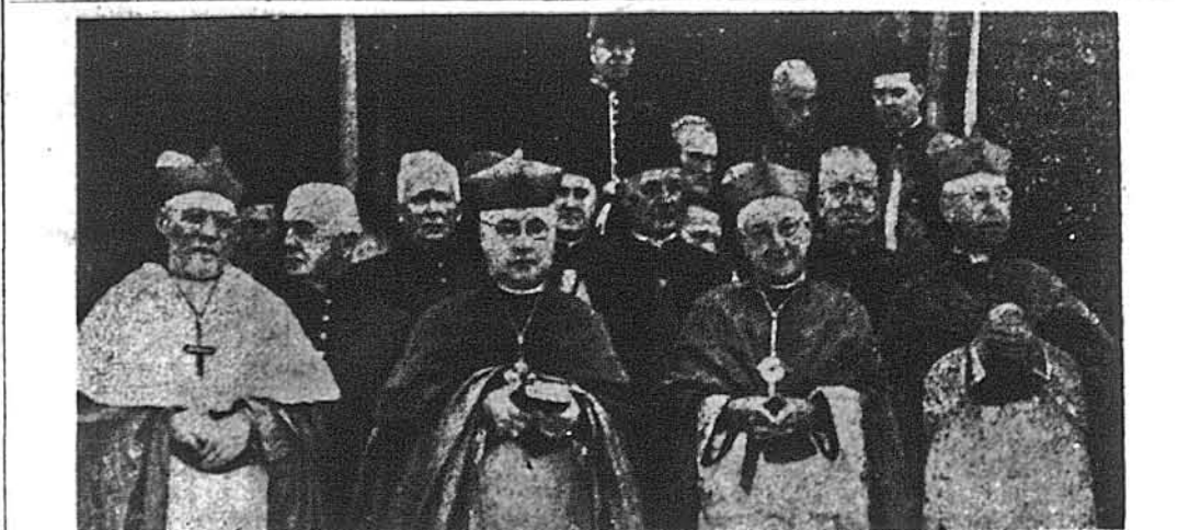
ПОХОРОНИ КАРДИНАЛА. У Філадельфії в катедрі св. Петра і Павла відбулися величаві похорони кардинала Деніса Догерті. В похоронному обряді взяли участь понад 1,000 священників, на чолі зі своєю ієрархією. На фото в першому ряді (зліва): китайський кардинал Томас Тіси, кардинал Спелман з Нью-Йорку, кардинал Стріч з Шікаго і кардинал Муні з Дітройту.

Філадельфія, 8 червня. — З канцелярії Злученого Українсько Американського Допомогового Комітету пригадують усім новим іммігрантам законний обов'язок піврічного зголошення до ДП Комісії у Вашингтоні. Згідно зі законом, кожний новий іммігрант має впродовж найближчих двох років після свого приїзду переслати письмевне зголошення до ДП Комісії впродовж останніх 15 днів кожного червня