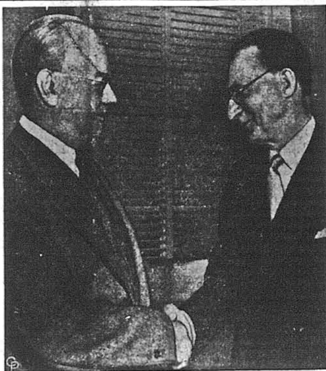
ІТАЛІЙСЬКИЙ ПРЕМ'ЄР АЛЬЧІДЕ ДЕ ГАСПЕРІ (зправа), передивившись вчорашню конференцію з президентом Труманом на нарадах зі секретарем скарбниці, Джаном В. Снайдером, з'ясувавши йому італійські потреби американської матеріальної допомоги, щоб Італія могла виконати перебрані обов'язки в спільній оборонній підготовці. Президент Труман описав записки прем'єра де Гаспері, що Злучені Держави одобрюють привернення Італії всіх прав вільної нації.

сту, прем'єр де Гаспері обговорював описав ще на пресовій конференції в Національному Пресовому Клубі.