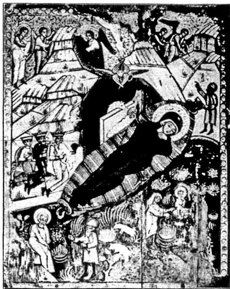
Різдво Христове. Ікона з Бусовиць на Бойківщині, XVI ст.