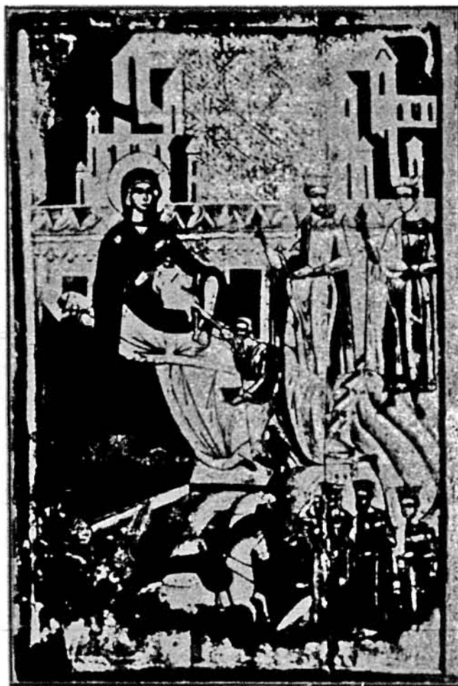
Поклоніння волхвів. Ікона з Бусовиськ на Бойківщині, XVI ст.