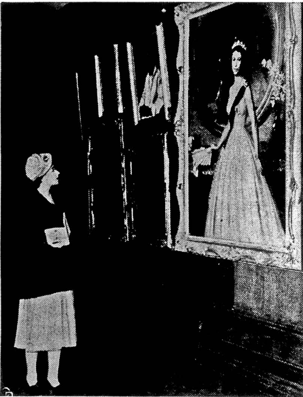
Англійська королева Єлисавета II оглядає свій власний портрет, що на ньому вона зображена в королівському одязі. Цей портрет намалював Дуглас Чондар і дав його на виставку, що її влаштувало Королівське товариство портретистів у Лондоні. Заходами п. Елеонори Рузвельт цей портрет буде привезений на виставку в ЗДА.

Поки ви слухаєте промов та реплік, ви одночасно підсуваєтесь уже й до самої ковбаси. На дверях напис: „Малоросійської немає і не буде. Сама лиш українська!“