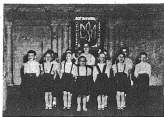
Хор юних сумівців з Осередку СУМА в Пасейку під час виступу в Нью-Йорку 13 червня ц. р. на вечорі самодільного мистецтва.