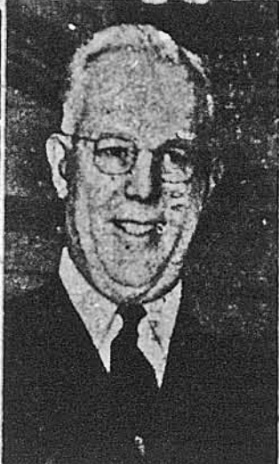
Головний суддя Воррен лоток, і президент Айзенгавер та всі гості залишили зал, в якій відбулася присяга.

Вашингтон. — Бувши каліфорнійський губернатор — Ірл Воррен перейняв 5 жовтня пост чотирнадцятого головного судді ЗДА. Церемонія присяги відбулася в присутності президента Айзенгавера і найвищих державних урядовців. З родини Воррена була присутня тільки пані Воррен. Під час складання присяги встали всі присутні, і Воррен, складаючи урочисту присягу такими словами: „Я, Ірл Воррен, складаю урочисту присягу, що як суддя буду виконувати свої обов'язки без огляду на особу, і буду признавати рівні права бідним і багатим... так мені, Боже, допоможіть!“ Після присяги представник генерального прокурора в Найвищому Суді Роберт А. Стерн формально представив Воррену генерального прокурора — Бранделла. Після цієї церемонії адмірал судейський мо-