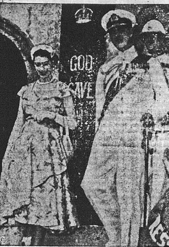
Королева Єлизавета II і її чоловік, князь Единбургу, виходять в товаристві губернатора Бермуд, сер Александра Гуду (ззаду), із старовинного парламенту після того, як королева Єлизавета промовляла до найстарішого в британській імперії бермудського автономного законодавчого тіла. Єлизавета є першою з-поміж британських монархів, що відвідала цей острів, починаючи свою шістнадцяту подорож по країнах британської спільноти народів.