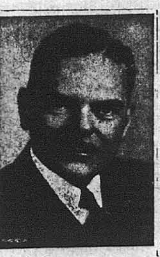
Губернатор Т. Дюї

● Бувши президент Геррі Труман грав на піано на концертній Американській Федерації Музики, де було присутніх 1,100 делегатів. З ним разом грав голова цієї федерації Джеймс С. Петрілло на сурмі. Вони виконали дуетову версію „Гейл, гейл да Гейл олл рі”. Велике мажорне піано, на якому грав бувши президент, подарував музикант бібліотеці ім. Трумана, яка буде побудована в місті Індіпенденс. ● Тютюнова і про мисливців призначила 500,000 доларів на дослідження, які мають вияснити, чи справді тютюн шкодить здоров'ю. На чолі цих дослідів стоїть д-р Кларенс С. Літл, який щодня за свою працю в найбільшій школі — 20,000 доларів. Д-р Літл має 65 років, курить люльку і раніше був директором Американського Товариства для Контролю над пістриком. ● 16-річний „евразійський” хлопчик Деніел Мейр прибув літаком з Індії до Нью-Йорку, щоб піддатися операції ока. В шпиталі св. Вісента йому пересаджено рогівку. Лікар заявив, що пацієнт почуває себе