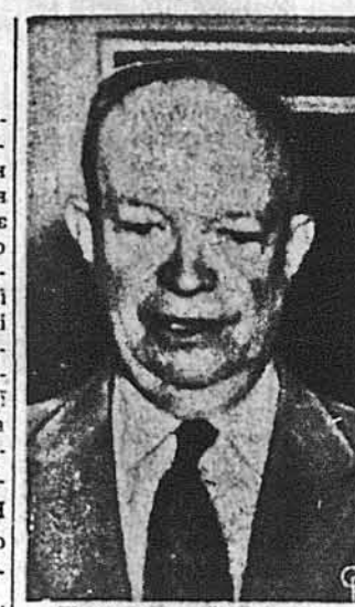
Президент Айзенгавер після висноски причини і цілей зустрічі з англ. державними мужами

Вашингтон. — „Ватіко водневої бомби” — д-р Едвард Теллер заявив, що внаслідок опозиції д-ра Роберта Оппенгеймера ЗДА спізнилася з продукцією водневої бомби найменше на чотири роки. Недавно т-членення Бюро Персональної Безпеки при Комісії Атомової Енергії ствердило, що хоч Оппенгеймер і є лояльним громадянином ЗДА, але з огляду на його відношення до продукції водневої бомби, не можна його допускати до таємниць атомової і водневої зброї. Д-р Теллер заявив, що, на його думку, „було б розумніше не