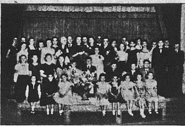
Відділ У. М. І. Ньюарк, Пасейк, Елізабет і Джерзі Сіті