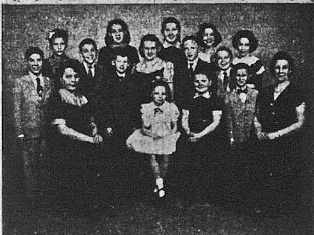
Відділ У. М. І. в Честер

архітектора, як він його на-міже згадки (ні в газетній згад, Івана Петровича Зарудного в українській За-ляді, поданому в розділі Угальній Енциклопедії немає раїна!) бкр.