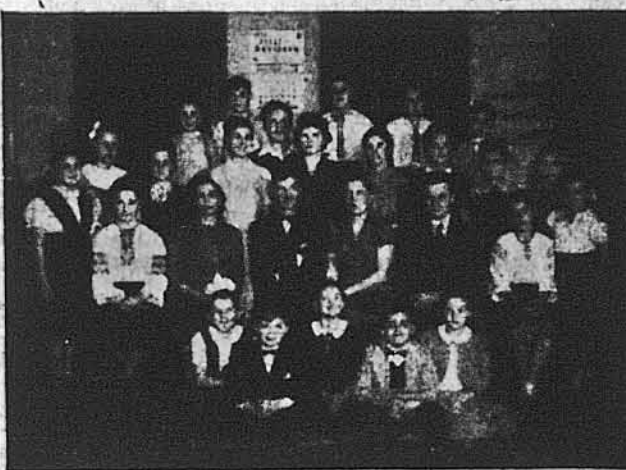
Відділ У. М. І. в Клівленді