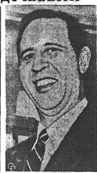
Чарльз Р. Говел, новий демократичний сенатор із стейту Нью Джерсі