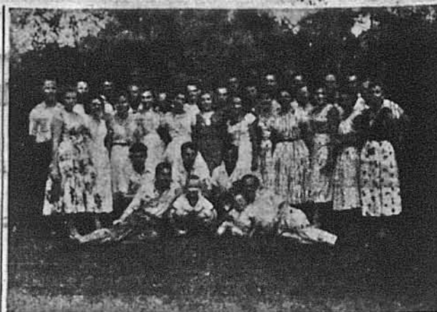
МЗН в Шикаго

Вважаємо, що в нормальних умовах в основі політичних партій лежить в першу чергу економічно-соціальне, психологічне та ідеологічне зрізачкування в лоні спільноти, та що крізь ці групи окремі шари населення беруть участь у політичному житті, обстоюючи свої інтереси та впливаючи у свою користь на рішення державної влади. А що у дво- чи багатопартійній системі одна група не має звичайно змоги повністю задовольнити свої аспірації без уваги на своїх суперників, у висліді партії примушені шукати компромісів, взаємно модифікувати свої позиції й політику, — узгіднені, як звичайно наближаються до того, що зведе загальним інтересом спільноти. Звичайно, характер партій та міжпартійних взаємин різняться в різних країнах, і нема сумніву, що надмірне розмноження партій, між якими ні чинна амбітних провідників, одна не спроможна здобути згд кандидатів на державних муніципальних посадах. Однак помилкою вважаємо думку, що партія шкідлива для нації, бо розбиває її єдність і т. д.