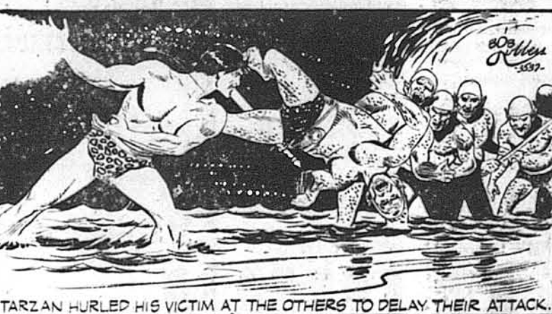
TARZAN HURLED HIS VICTIM AT THE OTHERS TO DELAY THEIR ATTACK.

Тарзан шпунував свою жер-ту на болотній істоті, щоб стримати їх напад.