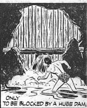
ONLY TO BE BLOCKED BY A HUGE DAM.

Проти нього була велика перевага, і він спробував вті- кати річковим каналом.