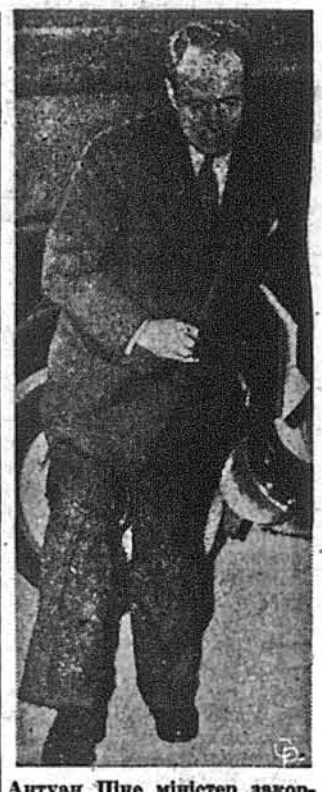
Антуан Піне міністер закордонних справ Франції, кваліфікується на надзвичайне заступництво уряду.