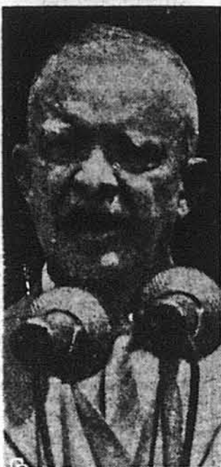
Президент Айзенгавер повідомляє про акцію в Лівані

перед зовнішньою інтервенцією. У своїй заяві з приводу десанту американської морської піхоти на ліванську територію, як і у своєму посланні до Конгресу, през. Айзенгавер ствердив, що цей десант не є воєнним актом і що уряд був примушений запобігти цьому десанту, щоб охоронити життя американських громадян на території Лівану і щоб допомогти його урядові зберегти ліванську територіальну суверенність і незалежність. Конечність цього виступу приспівали ще події в Іраку. Акцію през. Айзенгавера підтримали з усього рідного обидва попередні президенти ЗДА Герберт Гувер та Гаррі С. Труман. Гувер заявив, що през. Айзенгавер образ єдину дорогу для охорони свободи нації перед мілітарними конспіраціями, а Труман ствердив, що в сучасній ситуації, коли загрозливий світовий мир, през. Айзенгавер не мав іншого вибору. Опиція в Конгресі щодо конечності і необхідності американської акції поділена, але більшість Конгресу, передусім проводив обидвох партій і Демократичної і Республіканської підтримують заходи Президента, заявляючи, що він діє згідно із своїми уповноваженнями і з вимогами ситуації. Беззаперечно підтримують Президента в його акції всі громадська опінія країни.