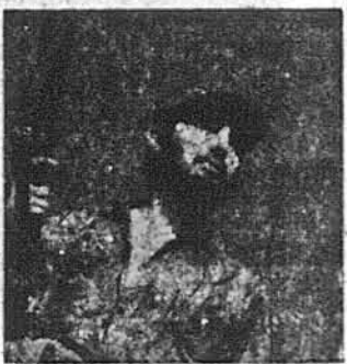
Фіделю Кастро, провідник кубинських повстанців

Гавана. — На сам Новий рік, дня 1 січня 1959 року, закінчилися для Куби доба режиму Фульгенсія Батісти, що володів цією країною, починаючи з 1933 року. З розвитком повстанських військ під проводом Фідела Кастро, які займали місто Сантьяго в центральній Кубі і здобули майже без ніякого спротиву ряд інших міст, кубинський президент Батіста втік вночі з 31 на 1 січня разом із своєю родиною, членами уряду і групою прихильників з Гавани в Домініканську Республіку. Десятки інших його прихильників втекли до ЗДА. Із втечею Батісти Гавана фактично під контролем Фідела Кастро, який проголосив уже раніше тимчасовим президентом Куби д-ра Мануеля Уррутію. Покинутий на становище шефа штабу збройних сил Куби полк Рамон Барріна, зв'язаний з в'язниці, де він перебував за свої симпатії до повстанського руху, звернувся із закликом до Фідела Кастро і д-ра Уррутію прибути до Гавани і проголосити тут новий уряд. Дотеперішній президент Куби Батіста, тікаючи, найменував для дальшого ведення країни військового хунту, очолювану генералом Кастильо, який, згідно з конституцією 1940 року, проголосив тимчасовим президентом Куби старшого суддю Найвищого Суду д-ра Карлоса Педра і призначив новим прем'єром Густаво Пелая. Фіделю Кастро і його командування відмовилися визнати проголошеного хунтою тимчасового президента і новий уряд і виражають їх негачий резистанції. Негачийно