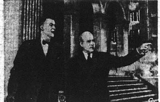
Американський посол в Сантьяго Чіле Волтер Гов (праворуч) разом із державним секретарем Крістіаном А. Гертером під час однієї із перерв у працях конференції міністра закордонних справ Західної Гемісфери.