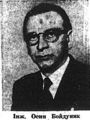
Інж. Осип Бойдуник

Нью-Йорк. — Інж. Осип Бойдуник, член Проводу Українських Націоналістів та відомий український діяч і публіцист, приїхав минулого четверга, 27-го серпня, літаком з Європи до Нью-Йорку на відвідинах родини і багатьох друзів у цій країні. Інж. О. Бойдуник відомий американсько-українській громадськості з його попередніх відвідин з кінцем 1955-го року та його виступів на численних зборах і вічах з доповідями на актуальні теми української та міжнародної політики.