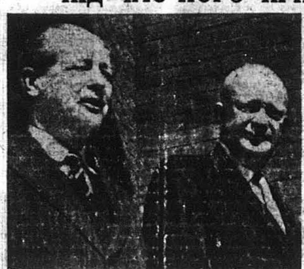
Президент Айсенгавер з прем'єром Великої Британії Гарольдом Мекмільленом