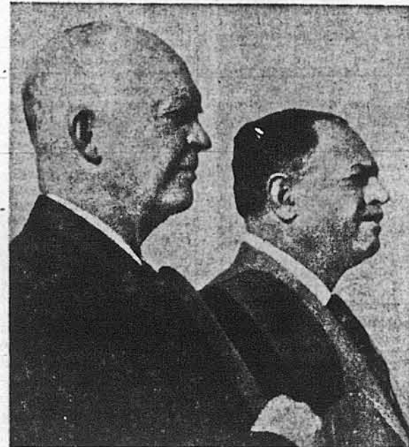
През. Айзенгавер з президентом Пакистану Аюбом Ханом у пакистанській столиці Карачі слухають Американського Гімну, що його грала оркестра на пошану високого гостя.