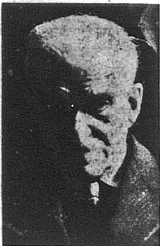
Проф. Олекс. Шульгин

В 1959 р. сповнилося проф. Олександрові Шульгину 70 літ його творчого життя, з чого 50 літ громадської і політичної праці. Проф. Шульгин — це один з чільних учасників і творців наших Визвольних Змагань, перший міністер закордонних справ Вільної України, а згодом один з наших найвизначніших дипломатів закордоном. О. Шульгин відомий, як письменник та мемуарист, — як дослідник і організатор наукового життя. Нині він заступник голови НТШ у Європі, голова Українського Академічного Товариства у Парижі, Віцепрезидент Міжнародної Вільної Академії, що в ініціатором та засновником він був. Тому «шкоро розуміло», що для найближчій з ним пов'язаній установи — Наукового Товариства ім. Шевченка й Українське Академічне Товариство, ринули скроном, агідно відзначити Ювілей свого заслуженого й передового члена. З тією метою покликано окремий Ювілейний Комітет,