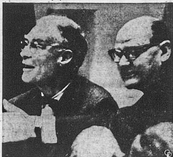
В ОЧІКУВАННІ НА ВИСТУП ПРЕЗИДЕНТА. Державний секретар Крістіан Гертер (ліва), що очолює американську делегацію на теперішній сесії Генеральної Асамблеї Об'єднаних Націй, та постійний представник ЗСД в цій міжнародній установі, посол Джеймс Вадсворт, прислухаються до виступу президента Айзенгавера.

Нью-Йорк, четвер, 22-го вересня. — Три години після закінчення виступу президента Айзенгавера в Об'єднаних Націях, президент Айзенгавер виступив перед журналістами в бібліотеці Річарда М. Ніксона, щоб промовити промову передбачену на годину 11-ту перед полуднем і передавати її по радіо і телебаченню. Напередодні виступу Айзенгавер виступив перед конгресом, у першу чергу справу контролювання розробки та допомоги новим африканським державам. Напередодні свого приїзду до Нью-Йорку президент Айзенгавер змінив деякі свої плани та рішуче залишитися у цій метрополі також упродовж наступного дня, в п'ятницю 23-го вересня. Під час свого побуту в місті Об'єднаних Націй президент Айзенгавер відбуде конференцію із югославським комуністичним шефом держави маршалом Тіто, який виконає з-під контролю Москви і тепер вараховується до негравальних держав між Сходом і Заходом. Конференція відбудеться в головній квартирі американ-